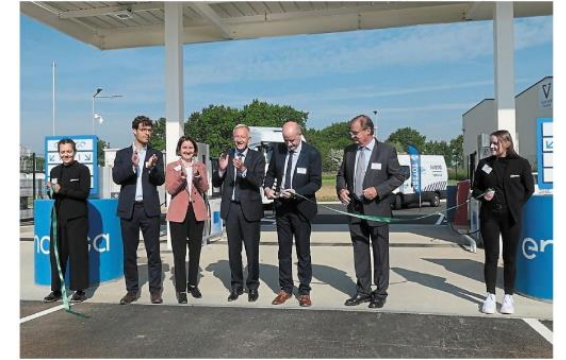
La station BioGNV inaugurée à Changé - OF 02-05-2022.

Le BioGNV est principalement utilisé pour les véhicules lourds (camions, bus, voire tracteurs), les moteurs électriques posant d'autres difficultés.