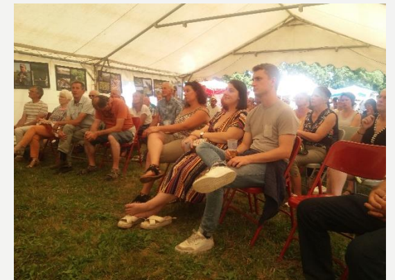
La FE 53 a animé une partie de la conférence sur la méthanisation à Planète en fête le 2 juillet à Craon.