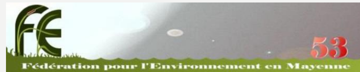
Image et document diffusé lors du webinaire

Sur le schéma ci-contre, le peu d'études montrent que 17 % des digestats ont un effet plutôt négatif sur la vie microbienne du sol par rapport à des fumiers...